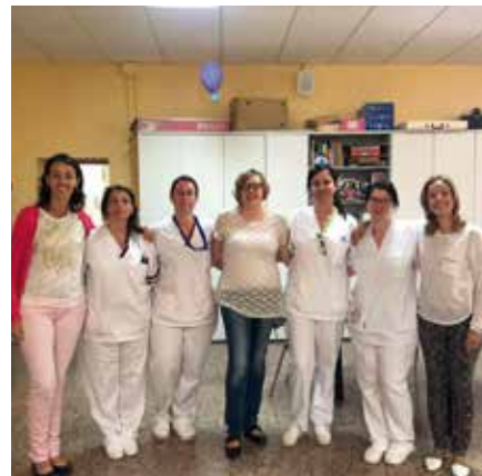
^ Miembros del equipo de la Residencia Borja.

física, mental y psicosocial respetando en todo momento su dignidad, autonomía e independencia. Este programa, creado por profesionales de DIGNITAS VITAE, se ha desarrollado en varias fases y ha tenido un periodo de implantación de año y medio.